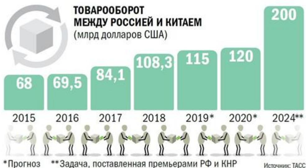
Рис. 1. Динамика товарооборота России и Китая

современных моделях модернизации экономики, инновационном развитии промышленности и сельского хозяйства, где Китай занимает одну из лидирующих позиций в мировой экономике. На Дальнем Востоке имеются богатые запасы древесины, рыбы и морепродуктов, однако не удовлетворяется потребительский спрос на товары легкой и пищевой промышленности. Производимые в этом регионе России зерно, овощи и мясо не обеспечивают и половины потребностей региона, в связи с чем остальные товары ввозятся из-за границы или других областей страны. Китай же может экспортировать в Россию излишки зерна и других видов продовольствия. Торговля, развивающаяся динамичными темпами, остается ключевой формой экономического сотрудничества, в том числе в рамках международных организаций ООН, АТЭС, БРИКС, ШОС. Эти связи позволяют успешнее включиться в интеграционные процессы в азиатско-тихоокеанском регионе.